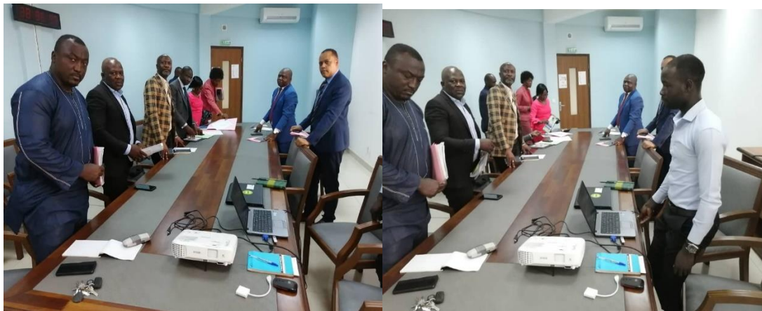
Fig. Rencontre d'échange ACFCAM/CTFC - FEICOM

Démarré à 10h, la réunion s'est achevée à 11h30